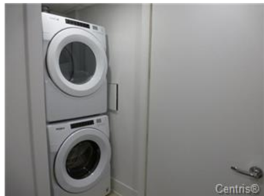
Salle de lavage