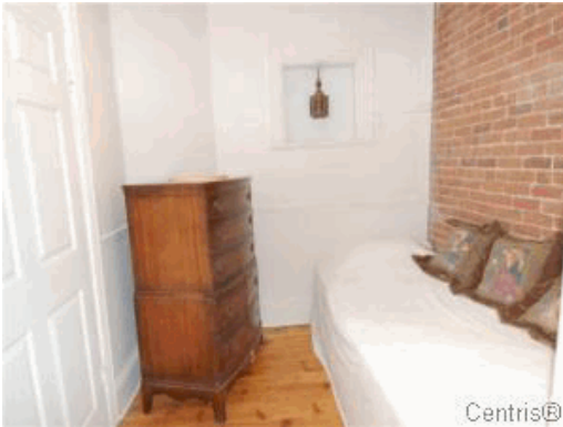
Chambre à coucher