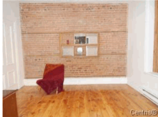
Chambre à coucher principale