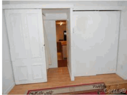
Chambre à coucher