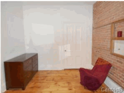
Chambre à coucher principale