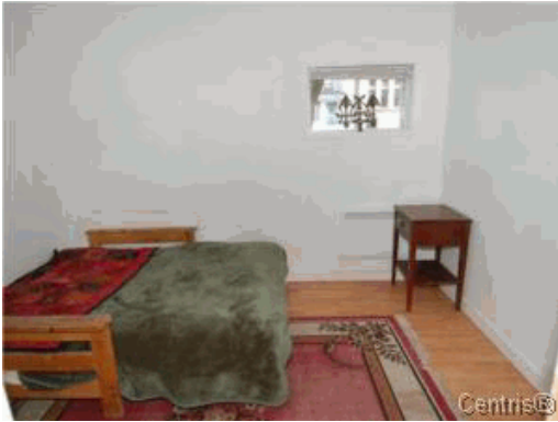
Chambre à coucher