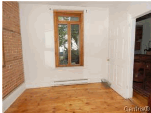
Chambre à coucher principale