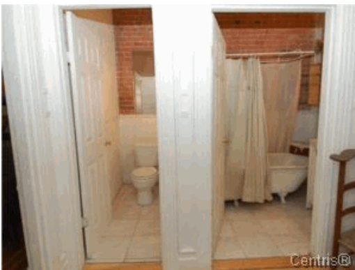
Salle de bains