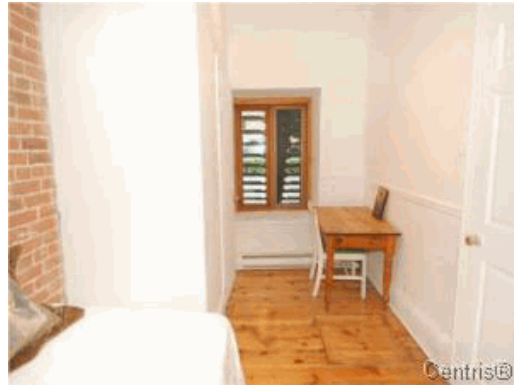
Chambre à coucher