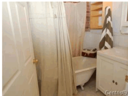
Salle de bains