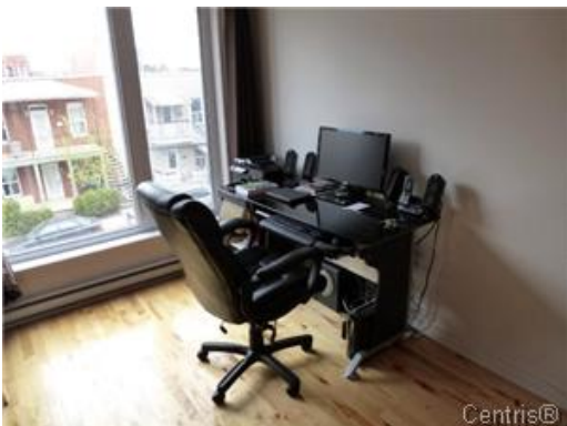
Bureau à domicile