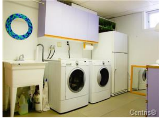
Salle de lavage