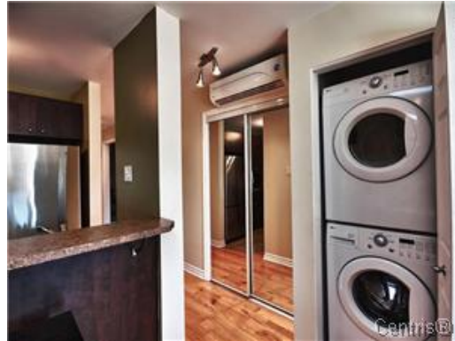
Salle de lavage