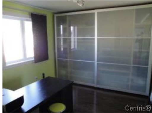
Chambre à coucher