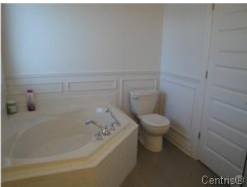
Salle de bains