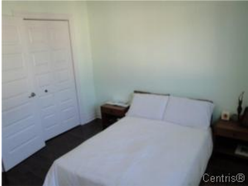
Chambre à coucher