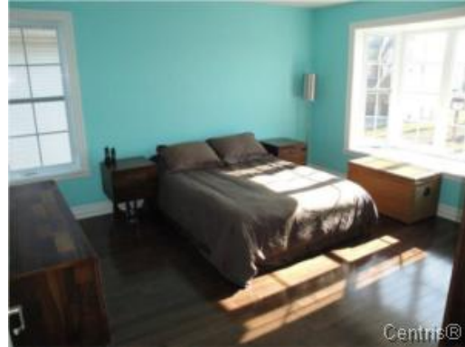
Chambre à coucher principale