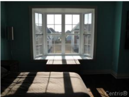
Chambre à coucher principale