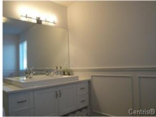
Salle de bains