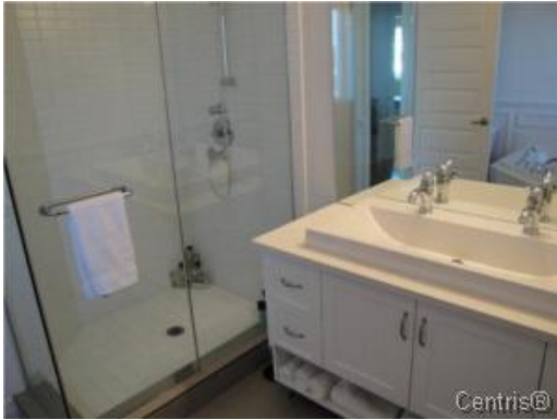
Salle de bains