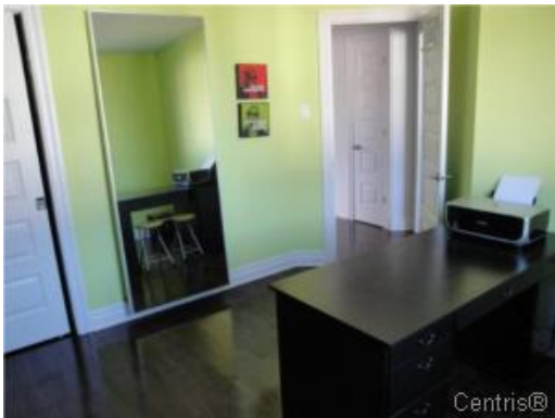
Chambre à coucher