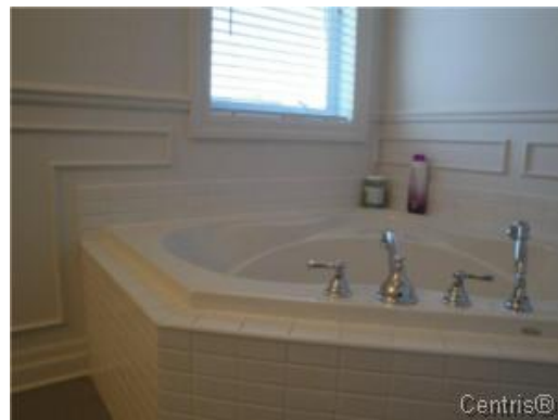
Salle de bains