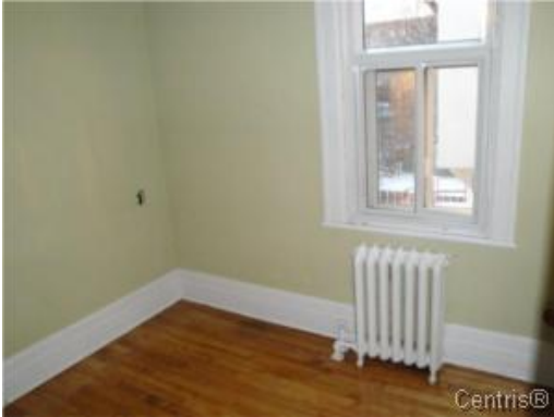
Bureau à domicile