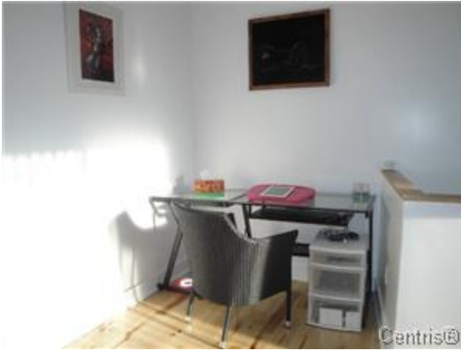
Bureau à domicile