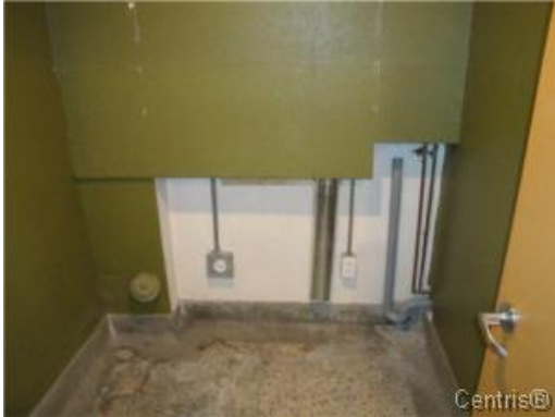
Salle de lavage